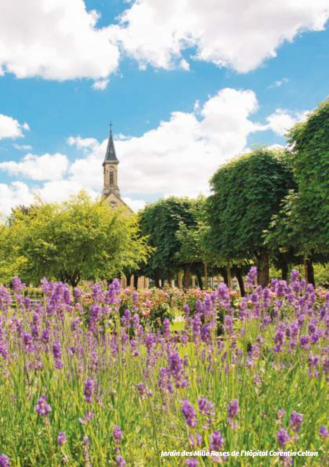
Jardin des Mille Roses de l'Hôpital Corentin Celton